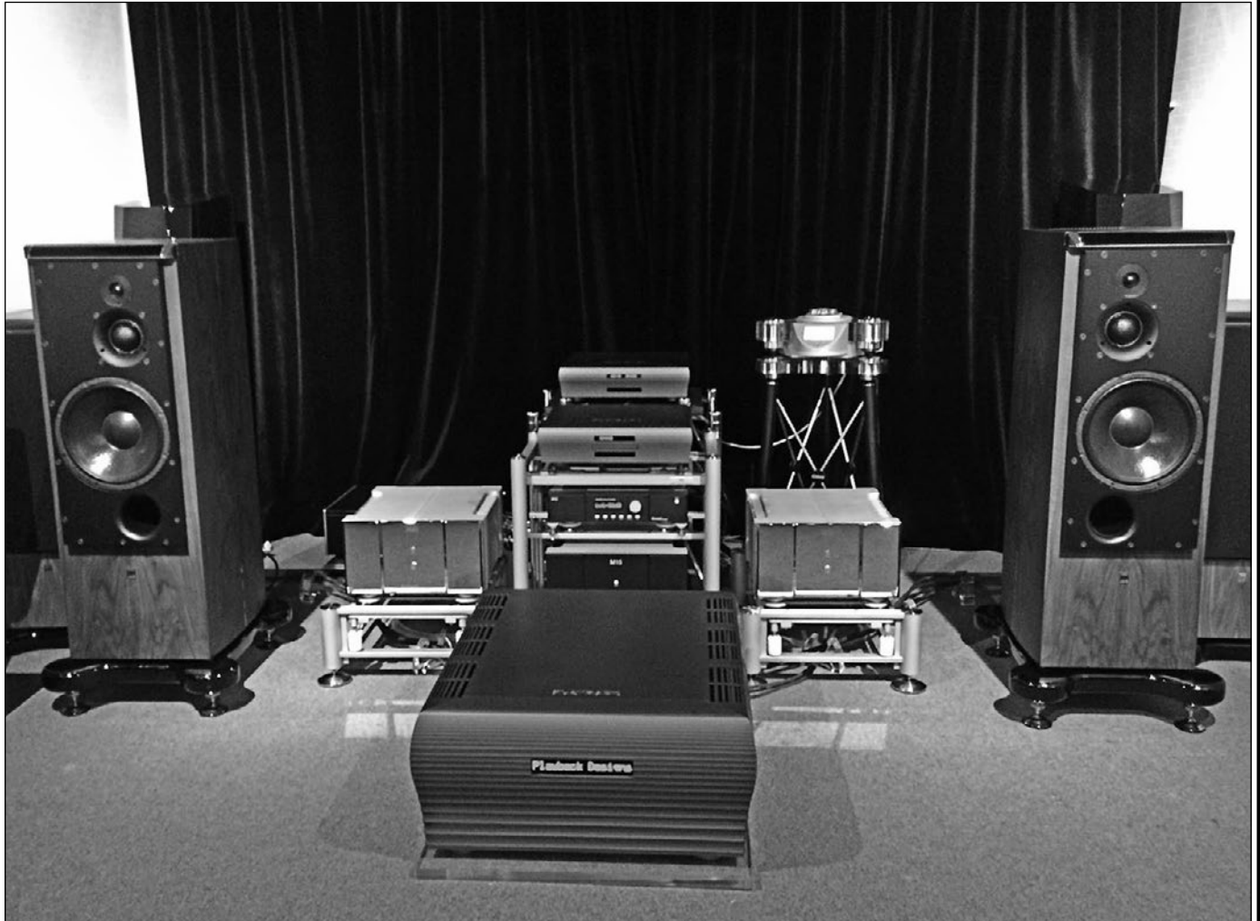
PLAYBACK DESIGNS SPA-8 示範音效驚人，亦見證了 ATC SCM-100SE 作為鑑聽揚聲器的聲音質素。

到尾都膽味盎然，令人全盤受落，回家後我又播放同一錄音來比較，結果在多台經典級膽機和石機之中，只有膽機具有同等甜潤的音色，但石機的音色豐潤度就明顯及不上 PLAYBACK，如果 SPA-8 是設計者「聽聲收貨」的產物，那麼他可能是膽機擁躉，又或者是，當石機設計到最完美時，聲音就像膽機一樣。